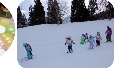
お家の人と一緒にリフトも上手に乗れたね

インストラクターの先生から丁寧に基本を教えていただき3日目の最終日はリフトに乗り全員が林間コースを滑ってゴールしました。一人ひとり自信を持って滑りおりてくる姿はとても遅しかったです