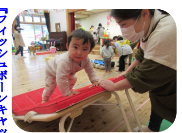
さくらさんもチャレンジ『壁とびサスケ』 落ちないように…『イスとびサスケ』