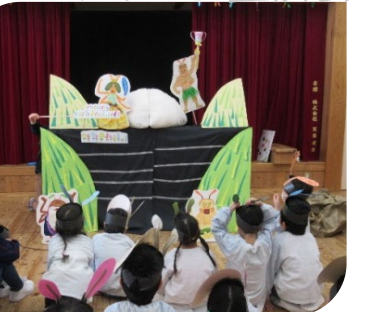
～ドロップス&南小5.6年生の皆様より～ 『しずくのぼうけん』『伝説の巨大あんぱんを運べ』 子ども達も一緒にお話の場面に参加して楽しみました

立春を迎えてからの大雪に心配した2月でしたが、バス時刻やお迎えの変更、ひまわり組スキー教室の日程変更など保護者の皆様からご理解とご協力をいただき安全に過ごす事ができました。大変ありがとうございました。外はまだ雪が残りますが、保育園のステージにはこども達が一生懸命作った『ひな人形』が段飾りの内裏雛と一緒に華やかに並び春の訪れを感じさせてくれています。一年間の集大成ともいえる“ひな人形製作”、それぞれの年齢に応じて色々な素材を使い、はさみや糊付け、折り紙の活動などひとつひとつ丁寧に一生懸命作業を進めて作り上げた作品はみんなとても素敵で、表情もどことなくその子らしさを感じられます。大切なこどもの健やかな成長を願う『ひな祭り』の行事。ここまで元気に成長できた事や、沢山の愛情に守られている事に感謝しながら、一人ひとりの成長をお祝いし3月3日のひな祭り会を楽しみたいと思います。春から一年、毎日の生活の中で自分でできる事を丁寧に積み重ねながら力を蓄え、友達や保育者とのふれ合いに心地よさを感じることで安心して自分を表現し、新しい事に挑戦したり色々な体験活動を楽しみながら、心も体もみんな大きく成長しました。3月は～みんな仲良し・ありがとう～をテーマに、こども達一人ひとりの成長を共に喜びながら巣立ちの月を大切に過ごしていきたいと思います。